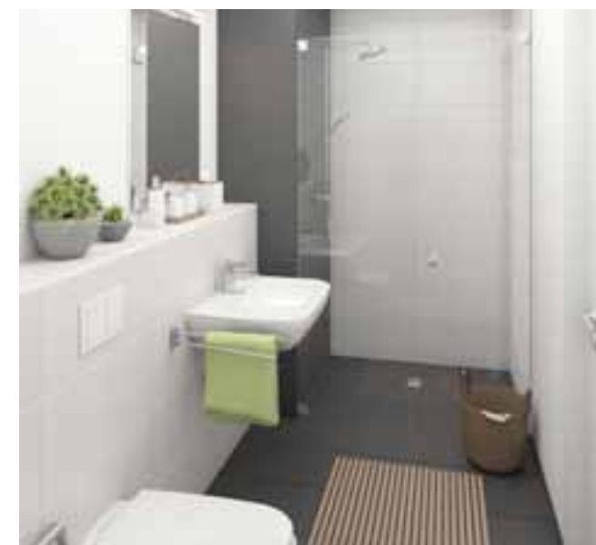
Modernes (unverbindliche Visualisierung) - kann Sonderwunsch enthalten.