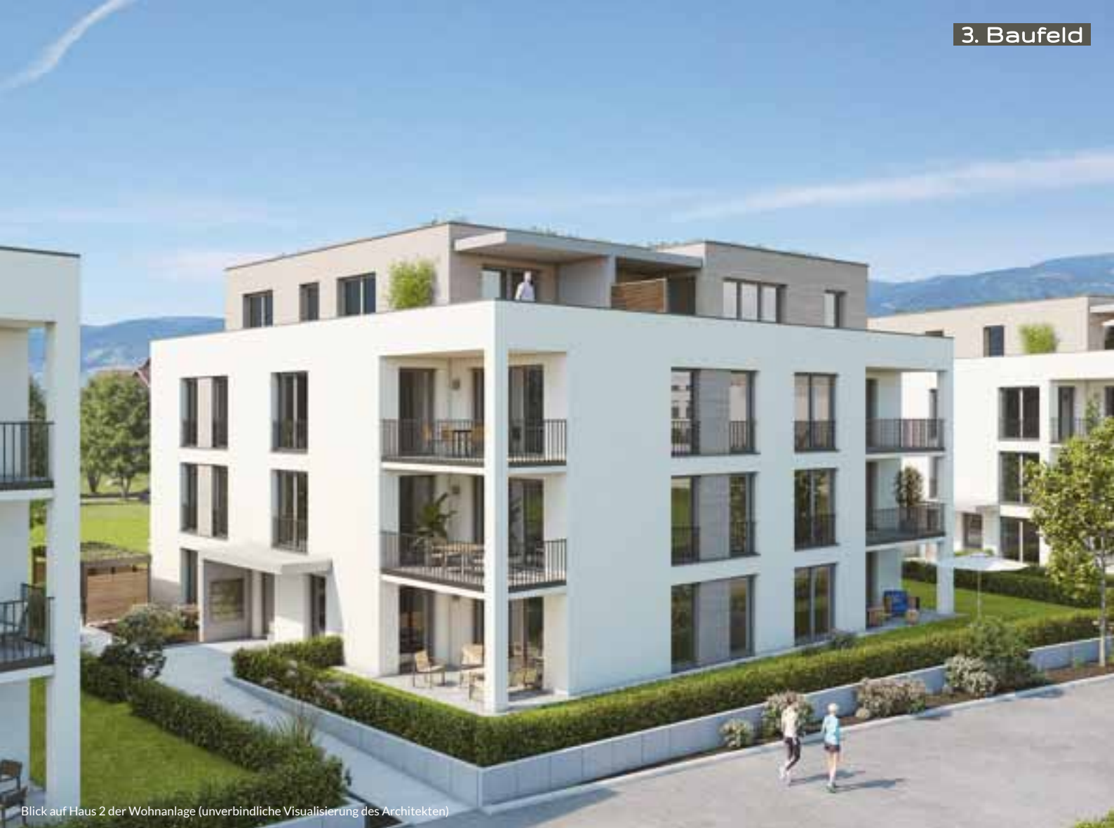
Blick auf Haus 2 der Wohnanlage (unverbindliche Visualisierung des Architekten)