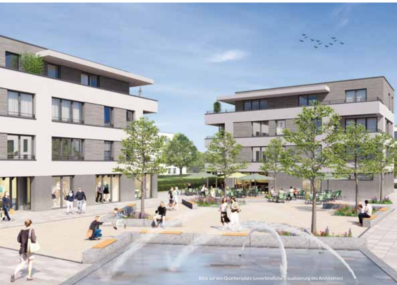
Blick auf den Quartiersplatz (unverbindliche Visualisierung des Architekten)