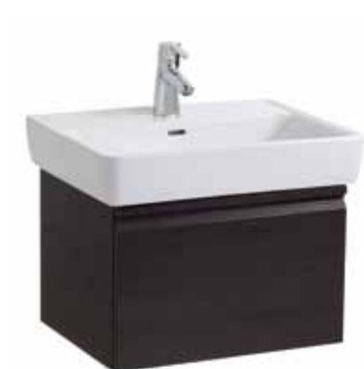
Auswahloptionen laut Konfigurator