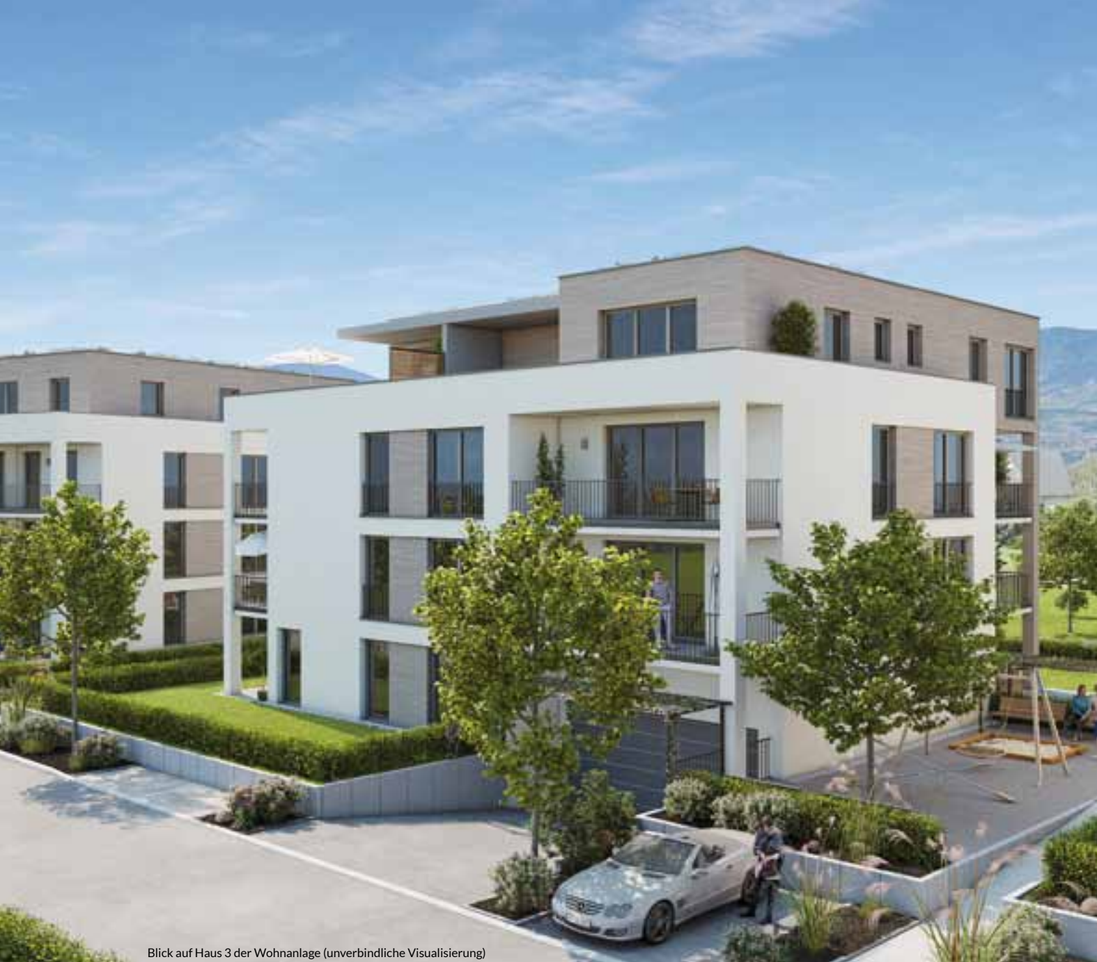
Blick auf Haus 3 der Wohnanlage (unverbindliche Visualisierung)